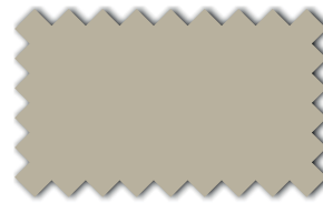
Ecru 393 07