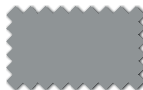
Mausgrau 393 28