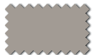
Taupe 393 48