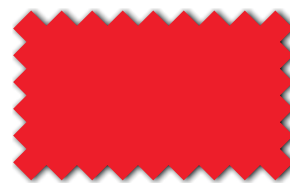
Hellrot 393 73