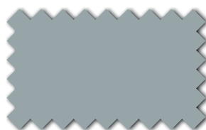
Perlgrau 393 08