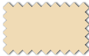
Cremeweiß 393 67