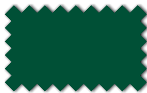
Moosgruen 393 06