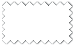
Weiß 393 09

acrylatbeschichtet, wasserabweisend imprägniert, reißfest, licht- und wetterbeständig, für optimalen Wind-, Sonnen- und Wetterschutz UV-Schutz: Ultra Protection Factor (UPF) 50+