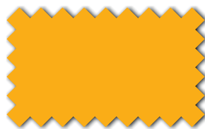
Gelb 393 01