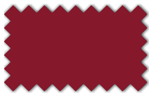
Weinrot 393 03