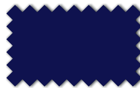
Königsblau 393 05