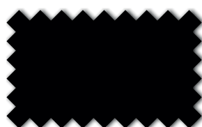
Anthrazitschwarz 393 49