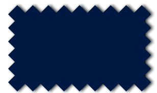
Marineblau 393 15