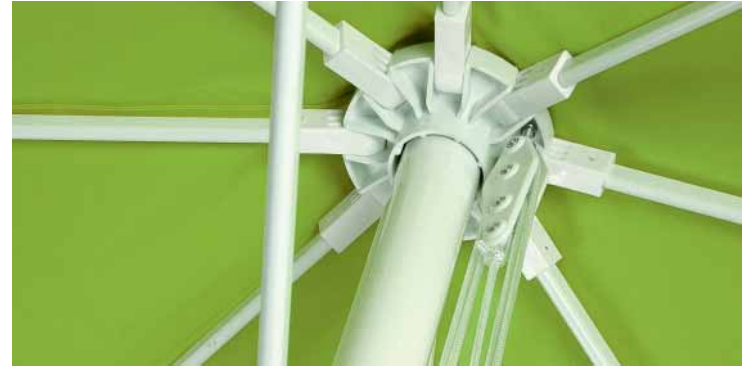
Seilzug mit Umlenkrolle pulley-system

Ihre Visitenkarte. Unser Gastro- und Werbeschirm mit Seilzug und benutzerfreundlichem Stecksystem. Da braucht man kein Werkzeug! Mit einem Mast aus Aluminium und Streben aus Aluminium oder Fiberglas = die robuste Vielfalt.