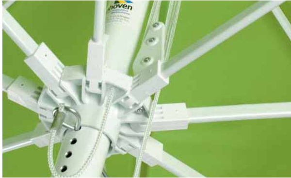
Streben wahlweise aus Aluminium oder Fiberglas, Verbindungen aus GFR aluminium or fibreglass supportings, GPR connectors